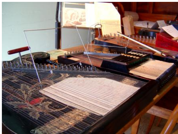
Akkordzitherausstellung in der Nebenstube

Dank der Initiative von Erika Koller und Gertrud Marcolin, Appenzell, wurde am 10. September ein Schnupperkurs für das Zitherspiel angeboten. 16 Teilnehmer/innen erschienen im Roothuus und füllten die Stube mit feinem und gleichzeitig warmem Klang. Ein ähnlicher Anlass soll 2009 wiederholt werden.