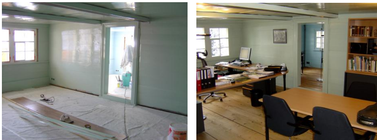
Im 2. Stock entstanden die neuen Büroräumlichkeiten für das ZAV.

Auch die monochrome Bemalung der Strickwände im ersten Stock (Schlafkammern, heute Büroräumlichkeiten) dürfte auf diese Umbauphase zurückgehen; auch wurden damals jene Fenster eingebaut, die sich bis in die Gegenwart erhalten haben; sie wurden restauriert und sind weiterhin in Gebrauch.