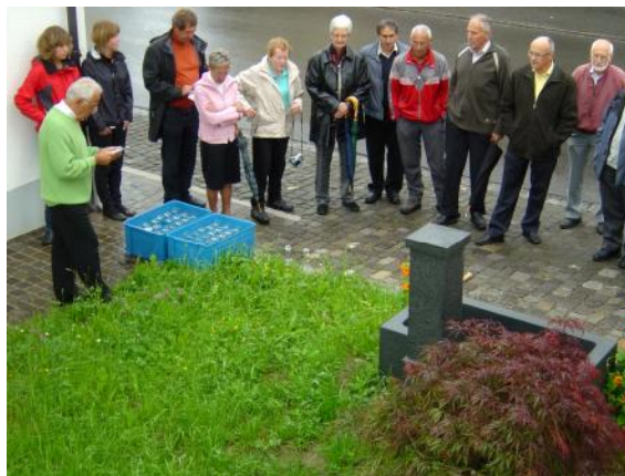
Einweihung des Brunnens neben dem Roothuus